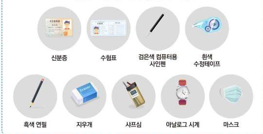
시험 중 휴대 가능 물품 (쉬는 시간 및 시험 중 소지 가능)