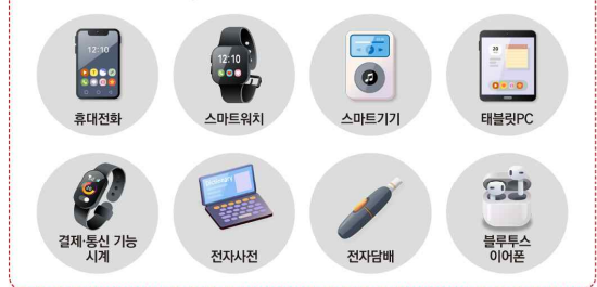
시험장 반입 금지 물품 (모든 전자기기)